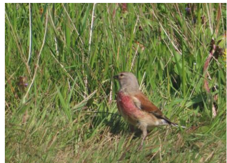
Linotte mélodieuse