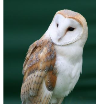
Effraie des clochers