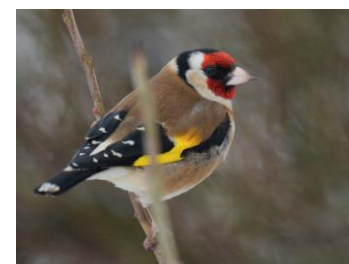
Bouvreuil pivoine

Le Bruant jaune Emberiza citrinella . 8 mâles chanteurs ont été détectés en 2022 répartis sur l'ensemble du site. Cette espèce affectionne les secteurs dégagés telles que les cultures et prairies pourvues de zones arborées ou arbustives. On le retrouve souvent chantant en haut des haies et lisières arborées. Ce passereau est en régression à l'échelle nationale de 53% d'après le suivi temporel des oiseaux communs (STOC) sur 20 ans. Il est Quasi-menacé NT à l'échelle régionale et Vulnérable VU selon la liste rouge nationale ;