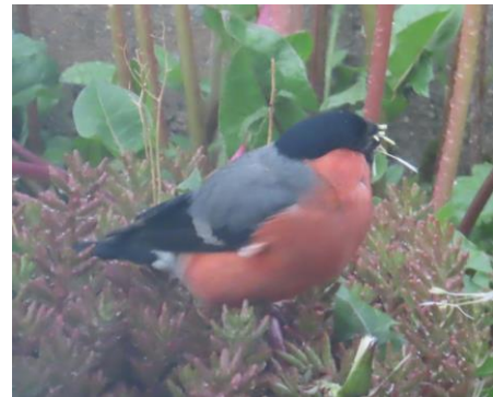
Bouvreuil pivoine

Le Bouvreuil pivoine Pyrrhula pyrrhula a été observé avec un individu survolant la zone au sud-ouest. Rappelons tout de même que les boisements du site sont favorables à sa reproduction. Le Bouvreuil pivoine évolue dans les forêts mixtes, parcs avec une strate arbustive. Il subit un fort déclin de 33% au niveau national d'après le suivi des oiseaux communs (STOC) ;