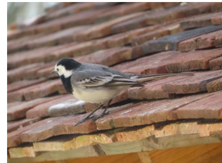
Bergeronnette grise

La Bergeronnette grise Motacilla alba est considérée comme Quasi-menacé NT sur la liste rouge d'Île-de-France . Un couple est cantonné à l'entrée sud de la carrière en 2022. Cette espèce niche dans les trous des murs et tas de pierres dans divers milieux ;