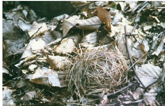
Nid de Muscardin

Le Muscardin est une espèce de lisières, si possible thermophile. Il est très sensible à la qualité des corridors écologiques car il ne s'aventure pas, ou rarement, en terrain découvert. De ce fait, c'est un bon marqueur de la qualité, c'est-à-dire de la fonctionnalité des connections. Le renforcement des haies par des plantations faisant appel à des essences adaptées à l'objectif recherché (ourlet herbacé, ronces, clématite, églantier, prunelier, aubépine, merisier, lierre.... Avec présence au sol de bloc de pierres pour l'hibernation) permettrait de soutenir et sans doute de renforcer la population locale. Le Muscardin est protégé et inscrit à l'annexe IV de la Directive Habitats . L'espèce n'a pas été revu en 2022 ;